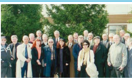
Российско-шведские ветераны - стройка